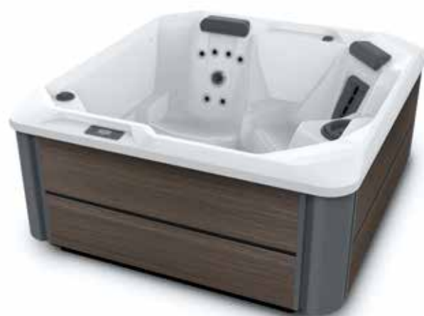
Modèle SX avec coque Blanc alpin et habillage Havana.